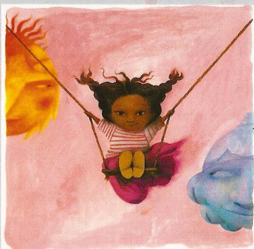
Il·lustracions: Ana Juan ©

19 h, sessió del Club de Lectura de la Biblioteca dedicada a l'obra Memòries d'un alamí , de Vicent Sanchis, amb presència de l'autor.